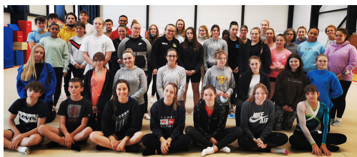
(Berck sur Mer)

Les 23 et 24 octobre a eu lieu le module animer sur toutes les formations animateurs : GAF, GAM, GAc et Parkour. Ils étaient réunis à Berck. Quant à la GR et la Petite Enfance, ils se sont retrouvés à La Madeleine.