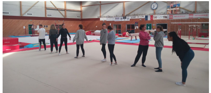
Formation Animateur Baby Gym et GR La Madeleine (59)

Retrouvez toutes les photos sur notre site internet :