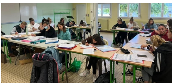
Niveau 1 à Chauny (02)