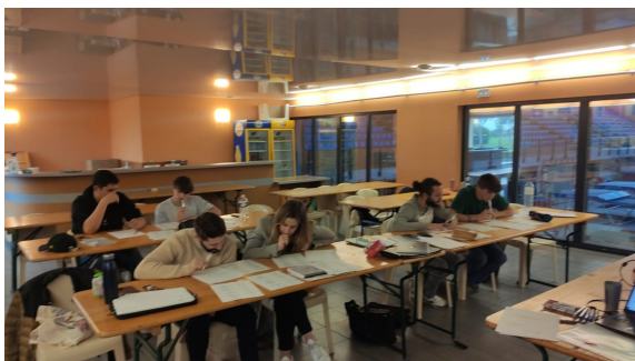
Niveau 3 et 4 à Arques (62)