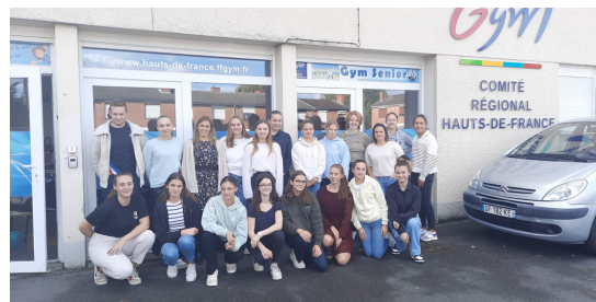
Niveau 3 à Cyoising (59)