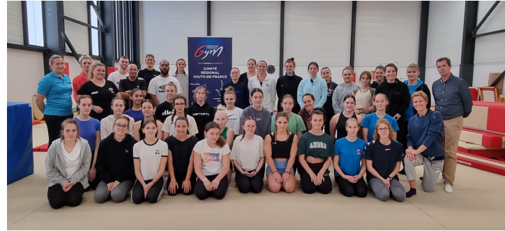
Formation Animateur/Moniteur GAM-GAF-GAc Berck-sur-Mer (62)