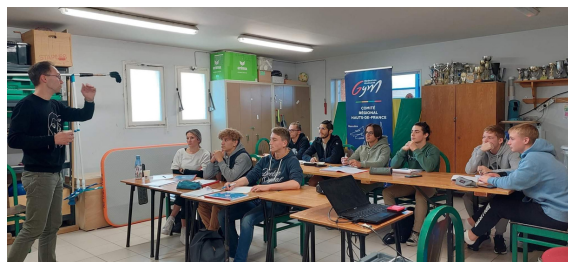
Niveau 1 et 2 à Fresnoy-le-Grand (02)