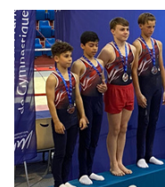
La Maubeugeoise (59)

Retrouvez tous les résultats sur notre site internet :