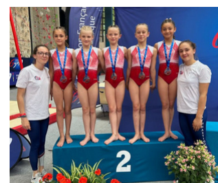
Saint-Quentin Gymnastique (02)

Nationale 2 10/11 ans : Saint-Quentin Gymnastique (02) => Vice-championnes de France