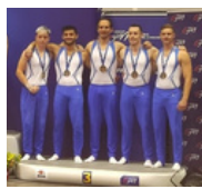
La défense d'Amblainville