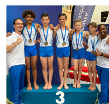
Défense Amblainville (60)