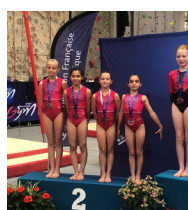
Héning Gym (62)