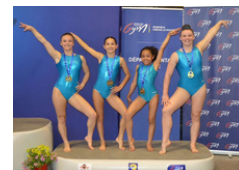
L'avant-garde de Lys-Lez-Lannoy

Retrouvez tous les résultats et photos sur notre site internet :