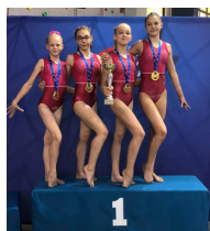
Héning Gym (62)