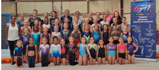
Oise et Aisne

Merci aux clubs de nous accueillir et aux entraîneurs pour leur participation.