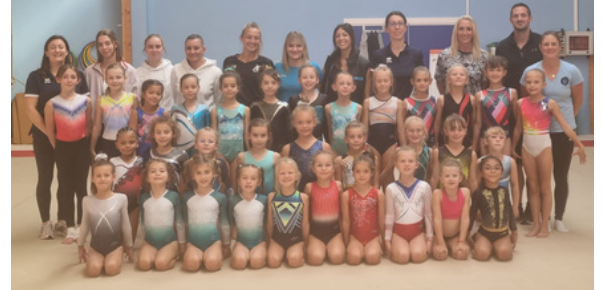
Somme et Pas-de-Calais