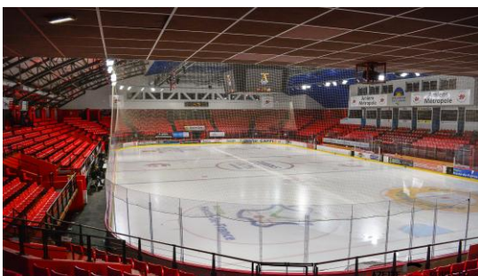
Salle de compétition